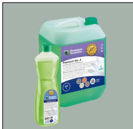
Prod. nr: 21078

Viktigheten av å bruke Premium no 4 for å vedlikeholde PUR-belagte gulv at det hjelper med reparasjon, beskyttelse, gjenoppretting og bevaring av gulvene dine.