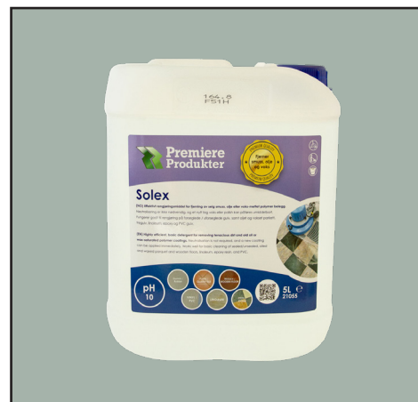
Prod. nr: 21055

Gulv blir brukt over tid og blir utsatt for trafikk, vil det kunne bli slitt i topplaget. Dette kan føre til behov for å utføre en oppskuring og vedlikehold av gulvet for å gjenopprette utseendet og beskyttelsen. Solex gulvrengjører er et utmerket valg for å utføre denne oppskuringen og vedlikeholdet. Den er spesialdesignet for å fjerne smuss, skitt, olje og fett fra både lakkerte og ulakkerte gulv. En av de unike egenskapene til Solex er at den også effektivt fjerner limrester etter tape, silikon og lignende. Dette gjør den svært anvendelig i ulike situasjoner og miljøer.