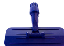
Padholder for skaff