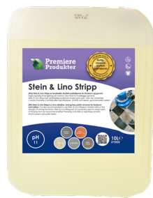
Stein & Lino Stripp