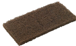
Håndpad Doodlebug Sort