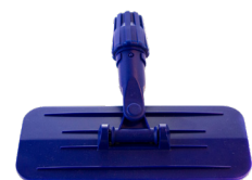
Padholder for skaff