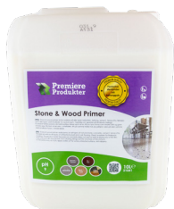
Stone & Wood Primer