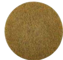
PP Twister Diamantpad Gul