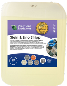
Stein & Lino Stripp