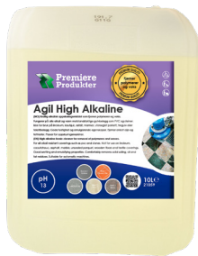
Agil High Alkaline