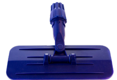
Padholder for skaff