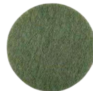
PP Twister Diamantpad Grønn