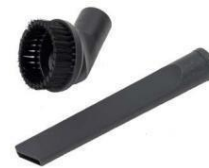
CREVIC TOOL & STØVBØRSTE