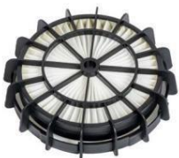
HEPA 13 FILTER