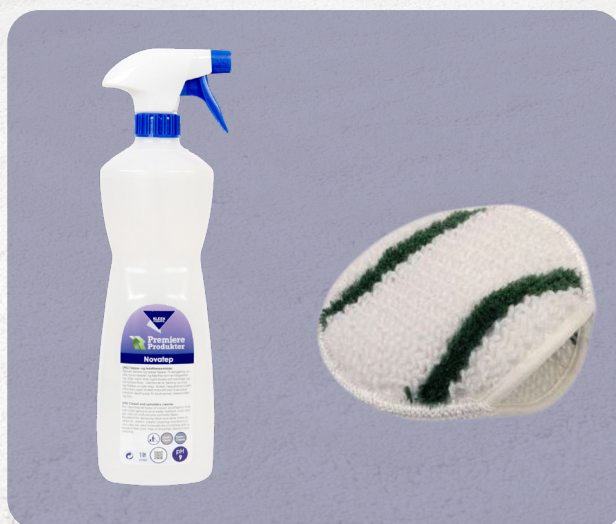
Novatep 1L Prod. nr. 21061

Bonnet mopp for tekstil - møbler – tepper: Har en sammensetning av polyester/rayonfibre som gir maksimal absorpsjonsevne, frigjøring og holdbarhet. Den grønne fiberstrimmelen gir ekstra skrubbing for å forbedre rengjøringseffektiviteten.