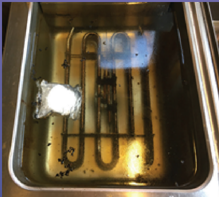
Grantit tab F. med folie legges oppi det kokende vannet