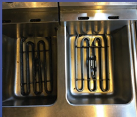
Frityrkokeren til høyre er rengjort med Granitt tab F og Purina. Legg merke til hvor rene varmekolbene er blitt.