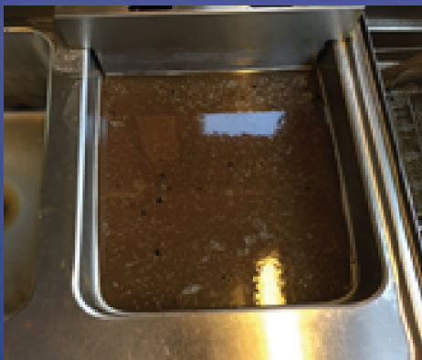
Vannet etter 20 minutters koking