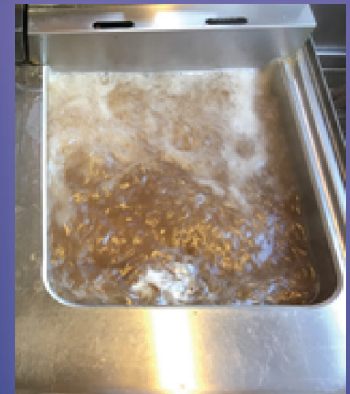
Vannet med Grantit tab F. skal koke i ca 20 minutter