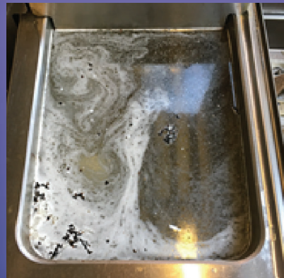
Grantit tab F. Løser seg opp og begynner å virke