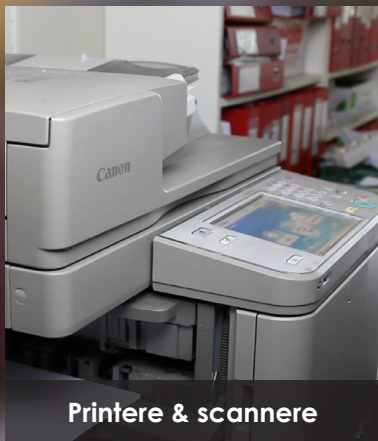
Printere & scannere