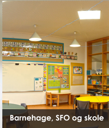
Barnehage, SFO og skole