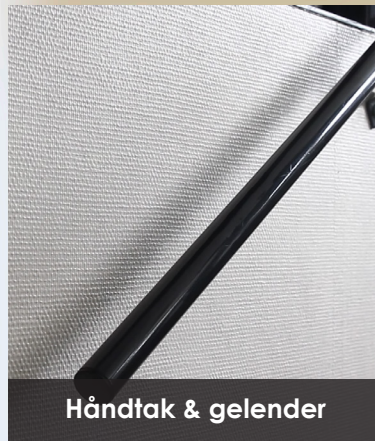
Håndtak & gelender