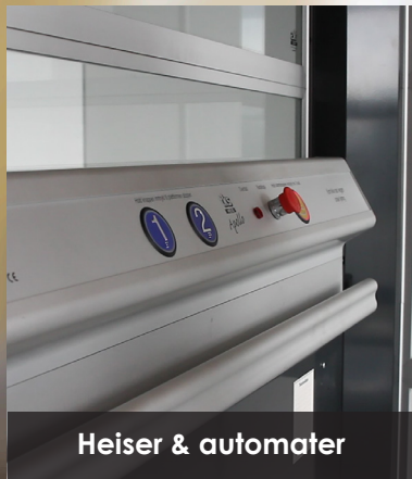
Heiser & automater