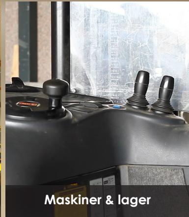
Maskiner & lager