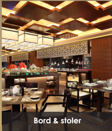
Bord & stoler