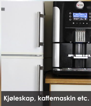
Kjøleskap, kaffemaskin etc.