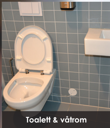
Toalett & våtrom